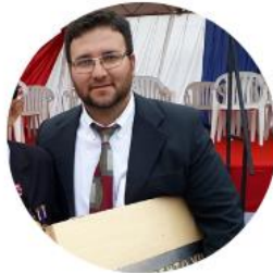
Hugo Arrua Educación y Cultura