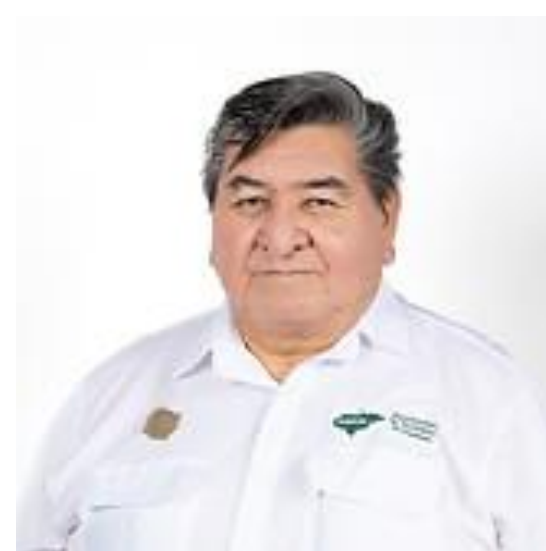
Alcalde de San Pedro de Tutule, La Paz