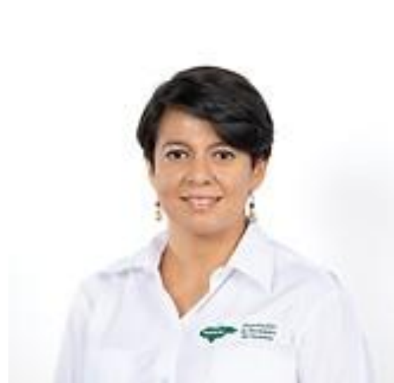
Alcaldesa de Lamani, Comayagua