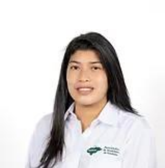
Alcaldesa de San José, La Paz