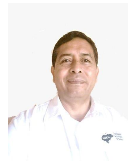
Alcalde de Intibucá, Norman Sánchez