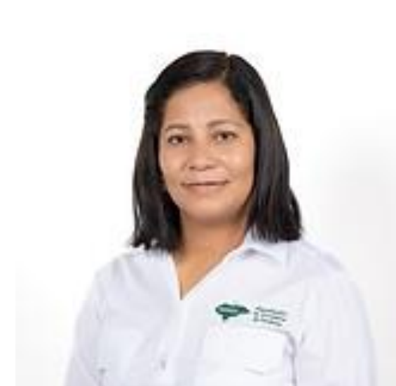
Alcaldesa de Guayape, Olancho