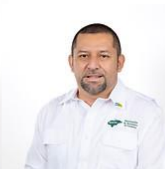
Alcalde de la Labor, Ocotepe