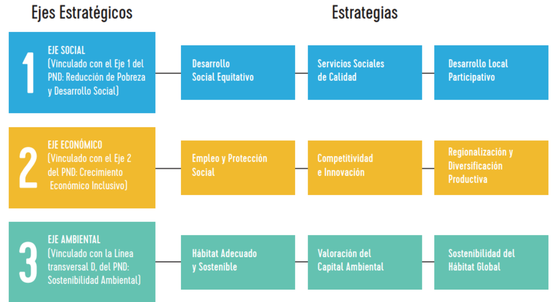
Gráfico 1 Estructura de formulación del Plan Desarrollo Municipal