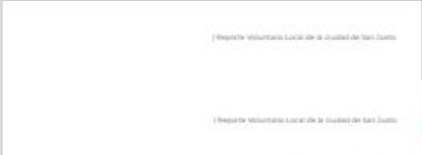
Reporte Voluntario Local de la Ciudad de San Justo