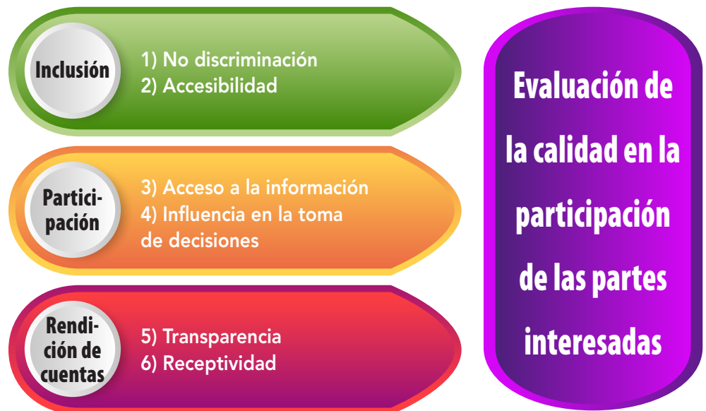
Diagrama 1: Principios y dimensiones del marco de análisis

En cada una de las dimensiones incluidas en el marco existen cuatro niveles , dentro de un continuo, para representar un aumento en la calidad de la participación de los actores interesados. El primer nivel (0) indica que se despliegan escasos esfuerzos respecto de la calidad en la participación de los actores. Los niveles subsiguientes (1-2) muestran un aumento en el empeño hasta alcanzar el nivel máximo (3), en el que se incluye un conjunto de criterios que demuestran una participación incluyente y colaborativa de los actores. Estos niveles se han estructurado de forma deliberada para que se excluyan mutuamente, con vistas a facilitar el análisis de las prácticas de participación de forma sencilla, aunque sólida . A continuación se ofrece una lista con las definiciones clave de los principios y aspectos que se recogen en el marco.